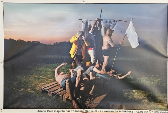
Arlette Pain inspirée par Théodore Géricault - Le radeau de la Méduse - 1819 © 2023/2024/2025