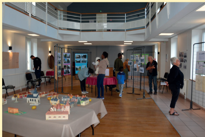
L'exposition au 104

De nombreux visiteurs ont pu découvrir l'intérieur de l'église et une exposition de vêtements sacerdotaux.