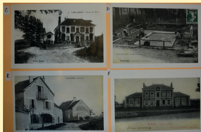
Des cartes postales à situer, facile pour certaines, beaucoup plus ardu pour d'autres.