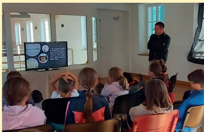
Les enfants des écoles devant le diaporama sur l'histoire de Voulangis