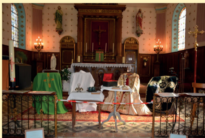
Exposition dans l'église des différents habits de cérémonie