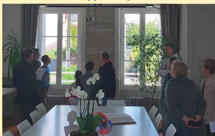
Visite de la mairie, devant les plaques des legs des œuvres sociales de l'époque.