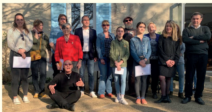
Photo de famille des artistes.