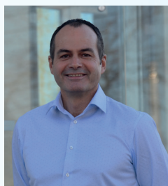
L'éditorial de Franz MOLET