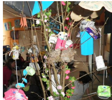
L'arbre aux oiseaux ▲