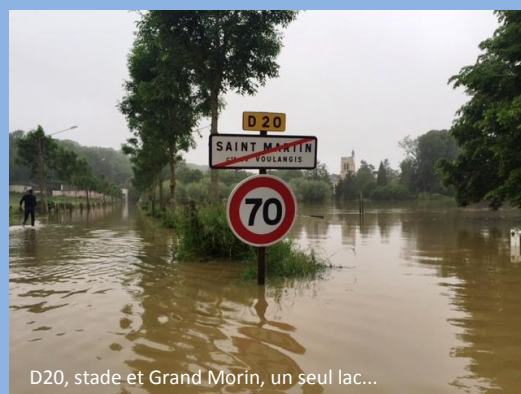
D20, stade et Grand Morin, un seul lac...