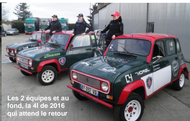
Les 2 équipes et au fond, la 4L de 2016 qui attend le retour