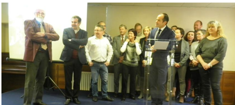
l'équipe du conseil autour du Maire.